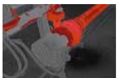
閾値設定機能 カラーアラーム機能