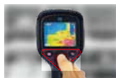
片手で全ての操作が可能