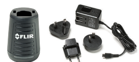
充電器(ACアダプタ付) ¥30,000