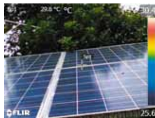
デジタルカメラモード

MSX ® 機能(スーパーファインコントラスト機能)は、リアルタイムで画像を補正することができ、構造物の詳細や発熱箇所の判別が熱画像上で容易に行えます。また、デジタルカメラモードとの同時撮影も可能で、同画角の可視画像を簡単に生成することができます。