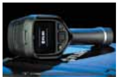
国内フルメンテナンス