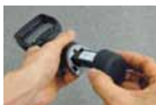
リプレーサブルバッテリー